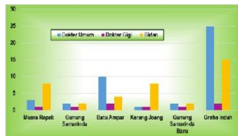
Banyaknya Banyaknya Tenaga Kesehatan menurut Desa/Kelurahan Balikpapan Utara 2015

Tersedianya tenaga kesehatan di masing-masing kelurahan turut melengkapi keberadaan fasilitas kesehatan yang sudah ada