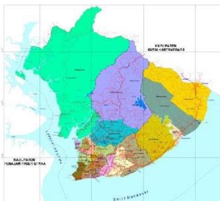
Peta Kota Balikpapan

Secara umum Kecamatan Balikpapan Utara beriklim panas dengan suhu udara pada tahun 2015 berkisar antara 26°C sampai dengan 27°C.