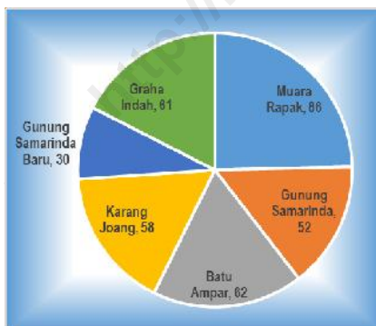
Jumlah RT per Kelurahan, Tahun 2015