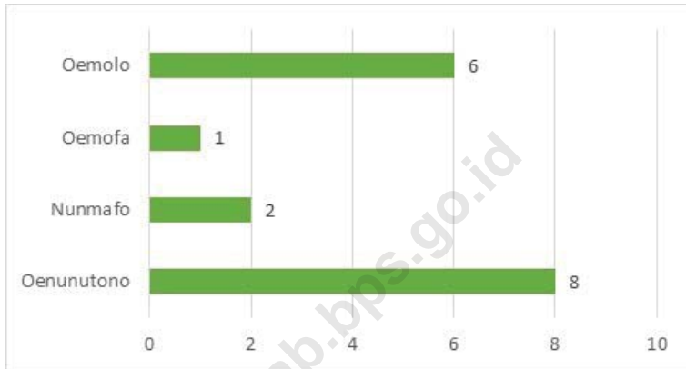
Gambar 1.1 Jarak ke Ibukota Kecamatan Menurut Kelurahan/Desa di Kecamatan Amabi Oefeto Timur (Km), 2021 Figures Distance to the Subdistrict Capital by Kelurahan/Village in Amabi Oefeto Timur Subdistrict (Km), 2021

Sumber/Source : Masing-Masing Desa/Each Village