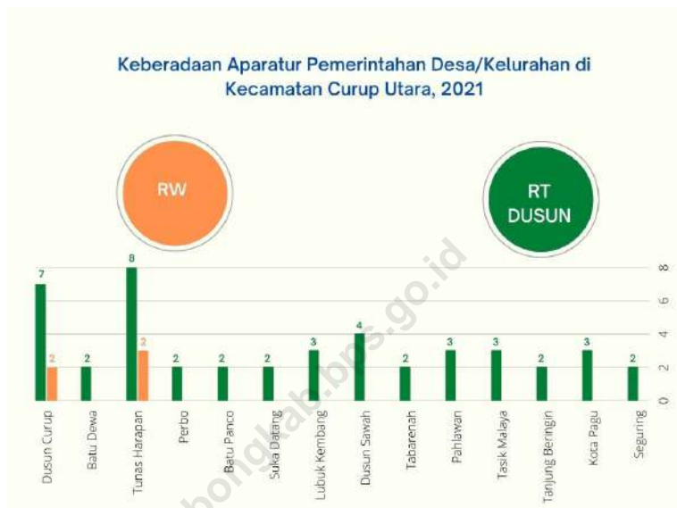
Gambar 2.1 Keberadaan Pelaksana Kewilayahan Desa/Kelurahan di Kecamatan Curup Utara, 2021