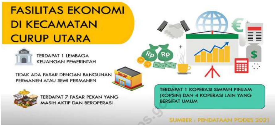
Gambar 7.1 FASILITAS EKONOMI DI KECAMATAN CURUP UTARA, 2021