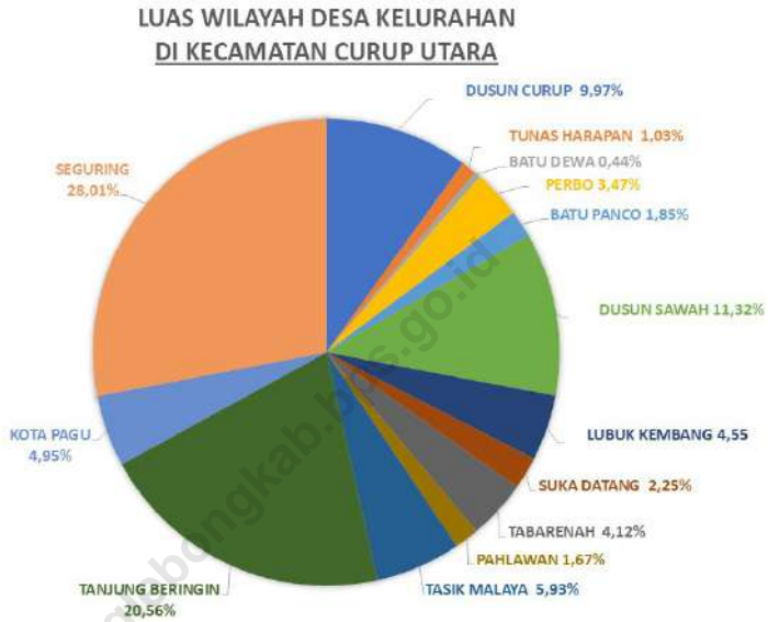
Gambar 1.1 Luas Daerah menurut Desa/Kelurahan (%), 2023