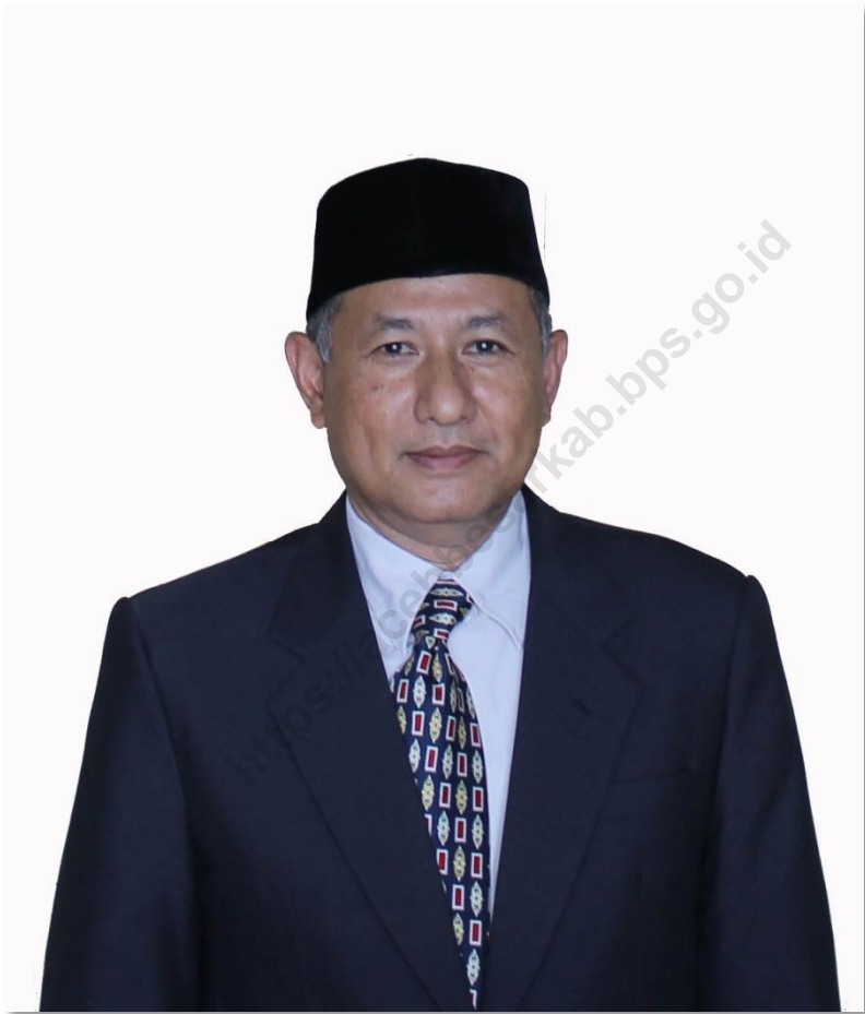
IRNANTO, ST, MM