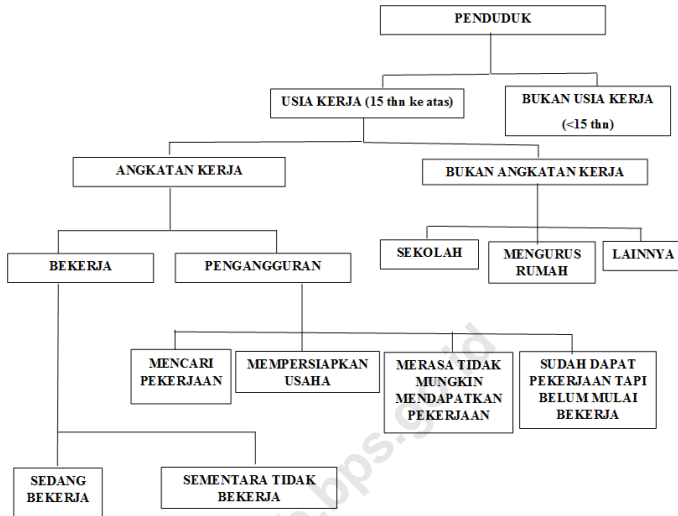
Gambar 1. Bagan Penduduk Usia Kerja

Sedangkan angkatan kerja terdiri dari penduduk yang bekerja atau sementara tidak bekerja dan pengangguran. Yang termasuk bagian dari bukan angkatan kerja terdiri dari penduduk yang pada periode rujukan ( time reference ) tidak mempunyai/melakukan aktivitas ekonomi, baik karena sekolah, mengurus rumah tangga atau lainnya (pensiun, penerima transfer, penerima pendapatan/bunga bank, jompo atau alasan lain).