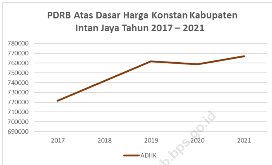
Grafik 3. Perbandingan PDRB Atas Dasar Harga Berlaku dan atas dasar harga Konstan 2010, Kabupaten Intan Jaya 2017-2021

Graph 2. GRDP at Constant Price 2010 by Expenditure, Intan Jaya Regency 2017 - 2021