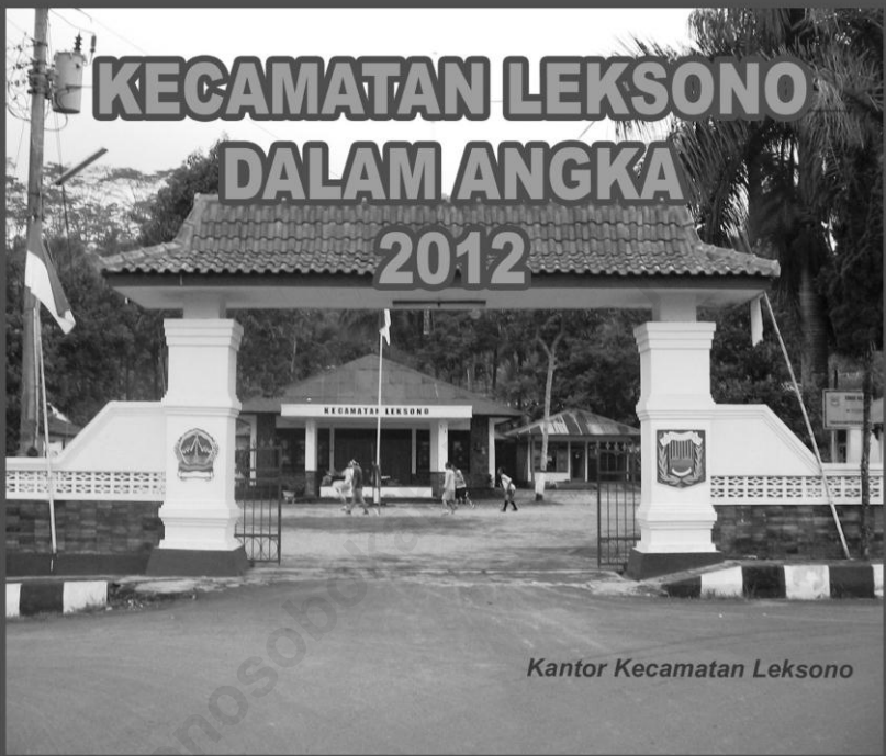
Kantor Kecamatan Leksono