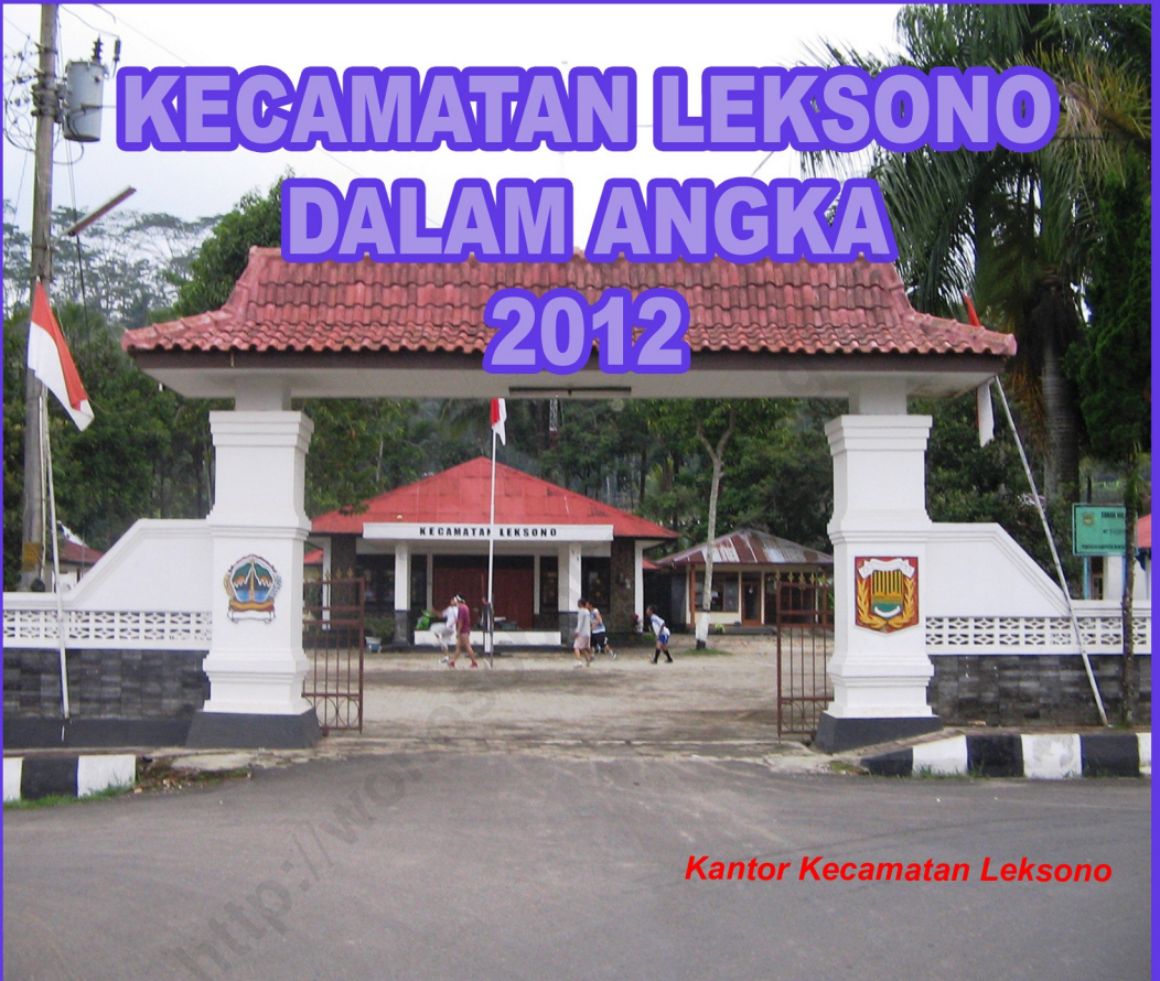
Kantor Kecamatan Leksono