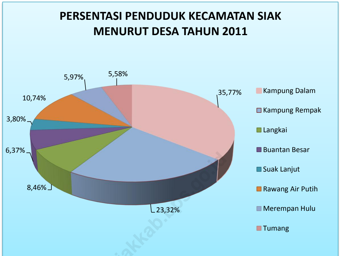
Grafik 3.1 Persentase Penduduk Kecamatan Siak Menurut Desa, 2011