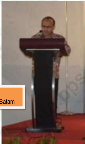
Laporan Kepala BPS Kota Batam