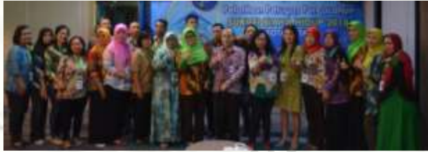
Kelas A Innas : Maharani

Nilai terendah/ Lowest Score : 46,68 Nilai rata-rata/ Average Score : 69,68