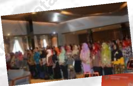
Pembukaan Gelombang 1 Tanggal 11 Juli 2017 Opening Ceremony 1 st Group 11 July 2017