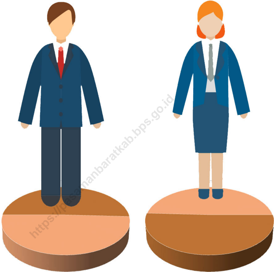
KOMPOSISI PENDUDUK KECAMATAN PASAMAN