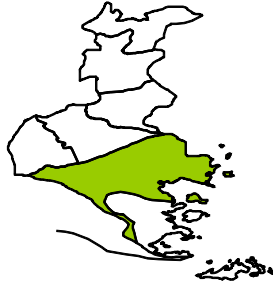
Tabel 1.1. Letak Kecamatan Padang Cermin Menurut Batas Wilayah, 2013