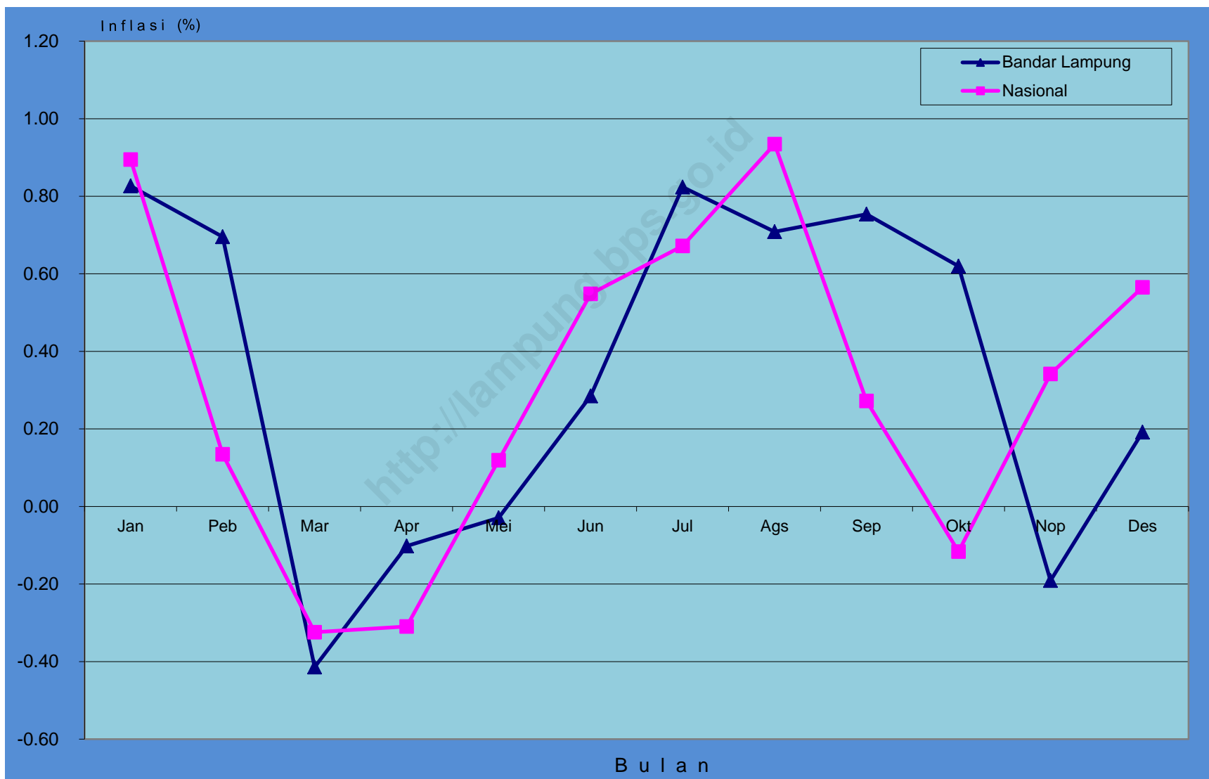
Gambar 1. 1. Inflasi Kota Bandar Lampung dan Nasional, 2011