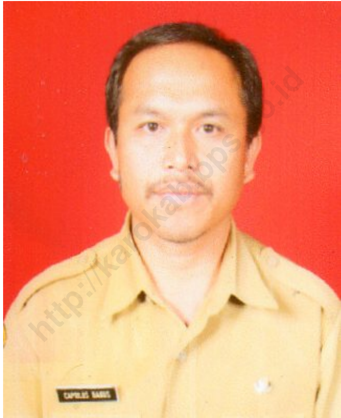
CAPRILUS BARUS, S. SOS