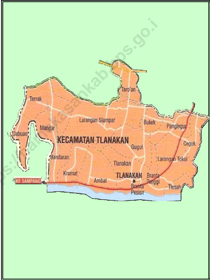
Grafik / Graph 1.2 Letak dan Batas Kecamatan Tlanakan di Kabupaten Pamekasan Position and District Boundary Tlanakan in Pamekasan Regency