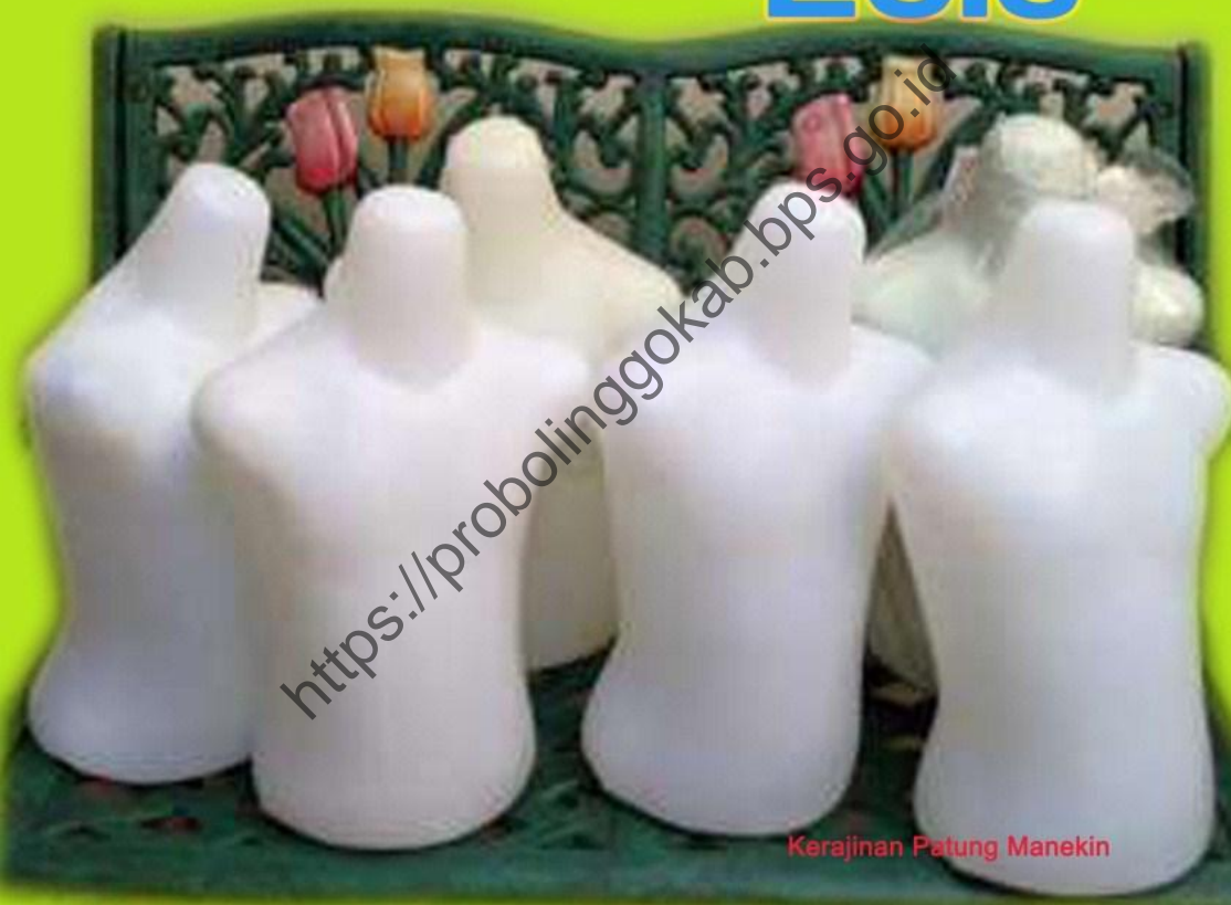
Kerajinan Patung Manekin