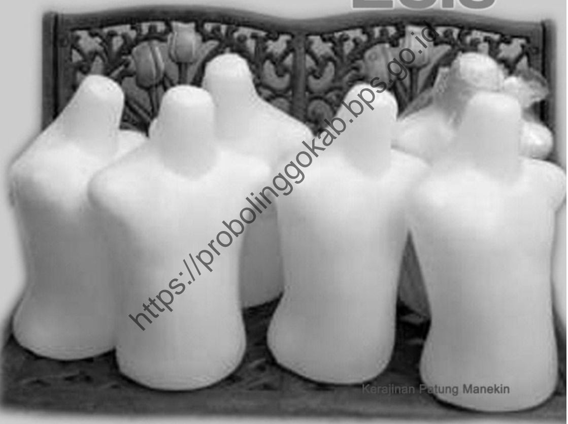
Kerajinan Patung Manekin