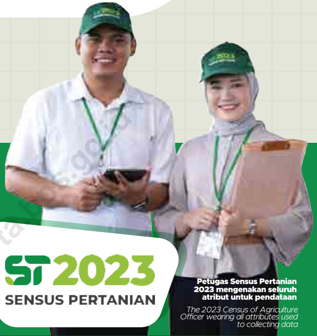
Petugas Sensus Pertanian 2023 mengenakan seluruh atribut untuk pendataan

The 2023 Census of Agriculture Officer wearing all attributes used to collecting data