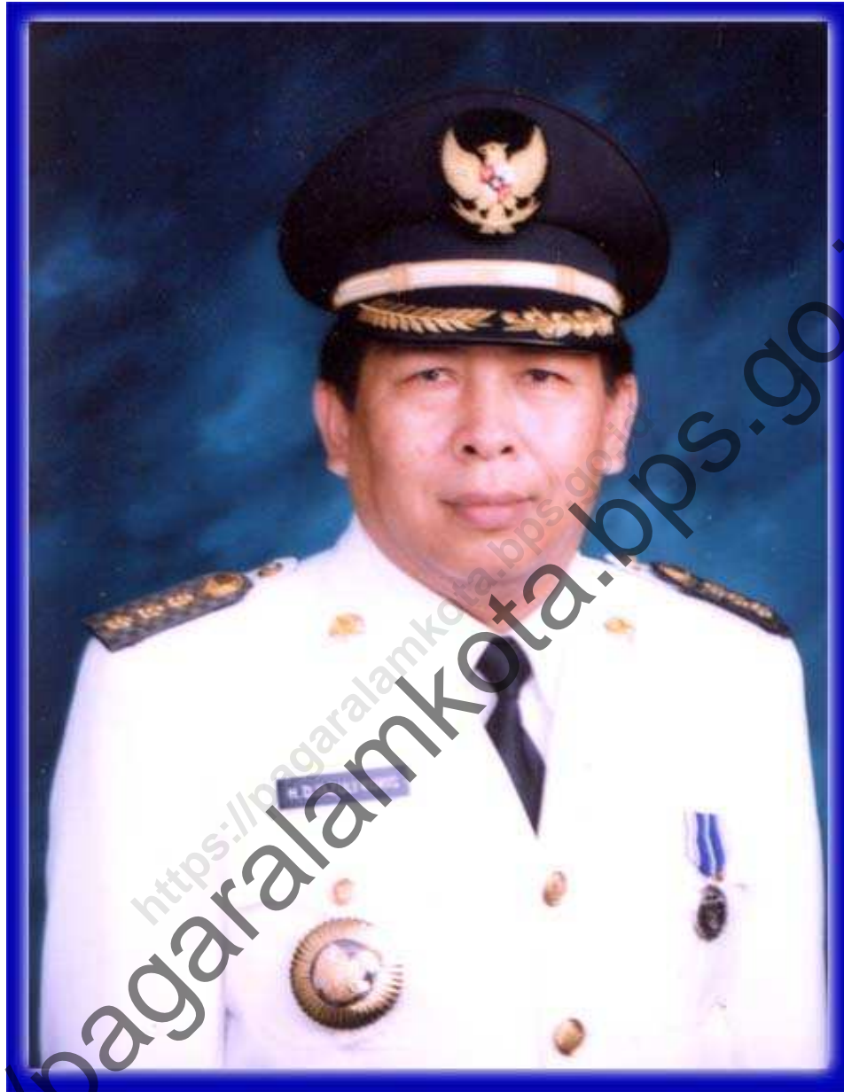
H. DJAZULI KURIS WALIKOTA PAGAR ALAM MAYOR OF PAGAR ALAM CITY