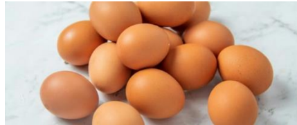
Telur Ayam Ras