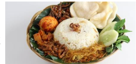
Nasi dengan Lauk