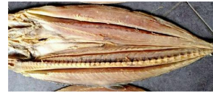
Ikan Asin Telang