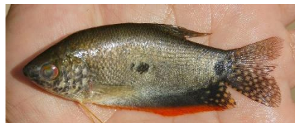
Ikan Sepat Siam