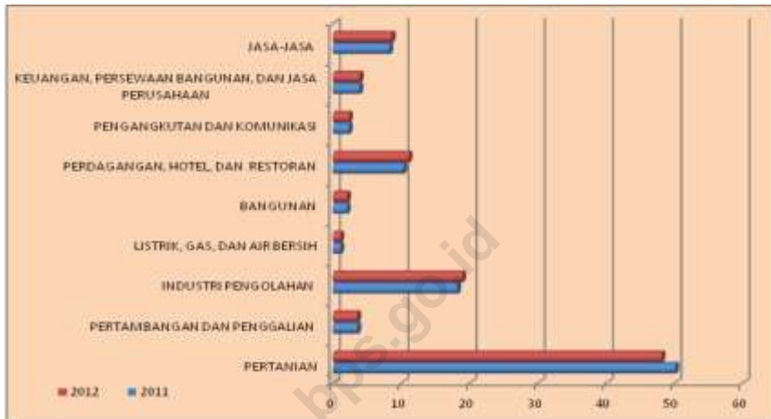
Gambar : 2. Persentase PDRB Menurut Lapangan Usaha Atas Dasar Harga Berlaku Tahun 2012

Sumber Data : PDRB Kecamatan Bangsalsari 2013