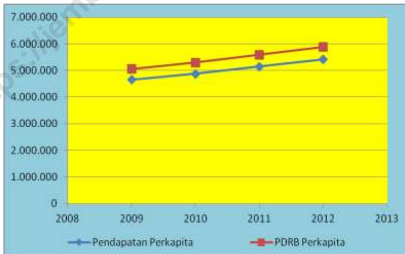
Gambar: 3. Perkembangan Pendapatan Perkapita dan PDRB Perkapita Atas Harga konstan Tahun 2009 – 2012 (000 Rp)

Sumber Data : PDRB Kecamatan Bangsalsari 2013