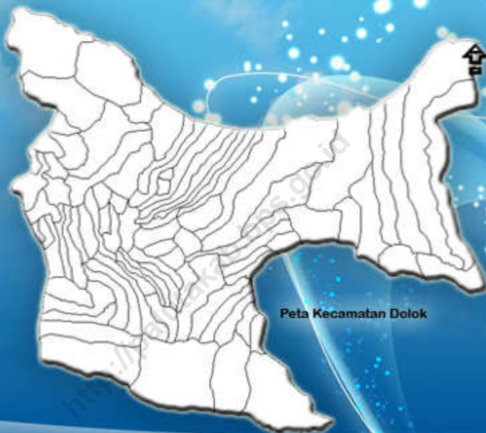
Peta Kecamatan Dolok