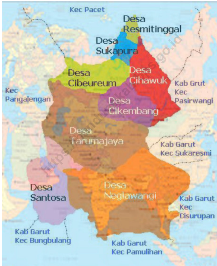
Piramida Penduduk Kecamatan Kertasari 2020 Population Pyramid of Kertasari Subdistrict 2020

Sumber/Source : Berdasarkan Peraturan Menteri Dalam Negeri No. 66 Tahun 2011 tanggal 28 Desember 2011 Based on Minister Of Home Affairs Regulation No 66/2011, December 28,2011