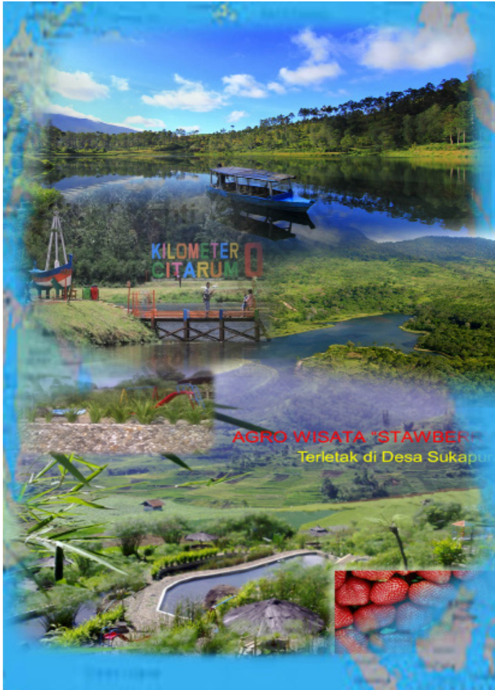
Gambar 8.1 Objek Wisata Unggulan Kecamatan Kertasari Figures Main Tourism Object in Kertasari Regency