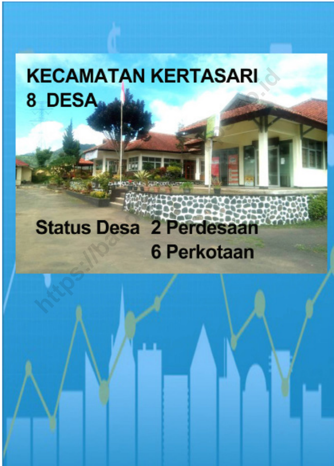
Jumlah Desa/Kelurahan di Kecamatan Kertasari, 2020 Number of Village/Urban Village in Kertasari Subdistrict 2020