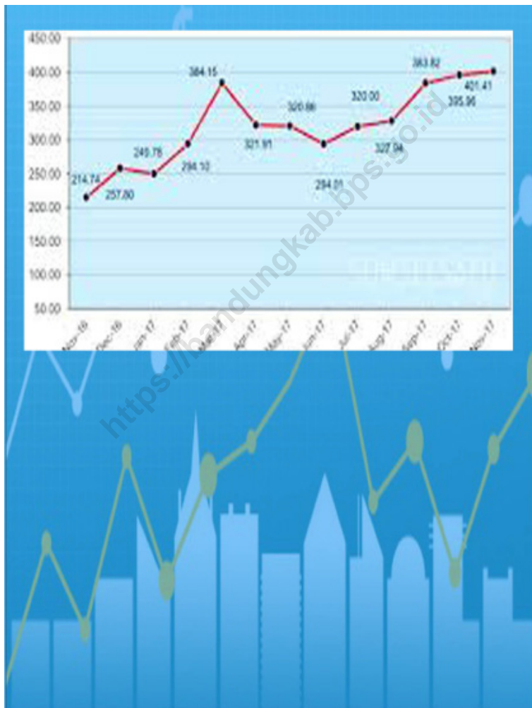
Gambar 7.1 Jumlah Pertambahan Surat Izin Usaha Perdagangan ( Siup ) Menurut Skala Usaha d Figures 7.1 Total Number of Trading Business License (SIUP) According to Business Scale

Sumber/Source : Berdasarkan Peraturan Menteri Dalam Negeri No. 66 Tahun 2011 tanggal 28 Desember 2011 Based on Minister Of Home Affairs Regulation No 66/2011, December 28,2011