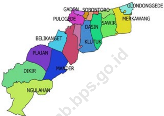
Gambar 1.1 Luas Daerah menurut Desa/Kelurahan (%), 2021 Figures 1.1 Total Area by Village/Kelurahan (%), 2021