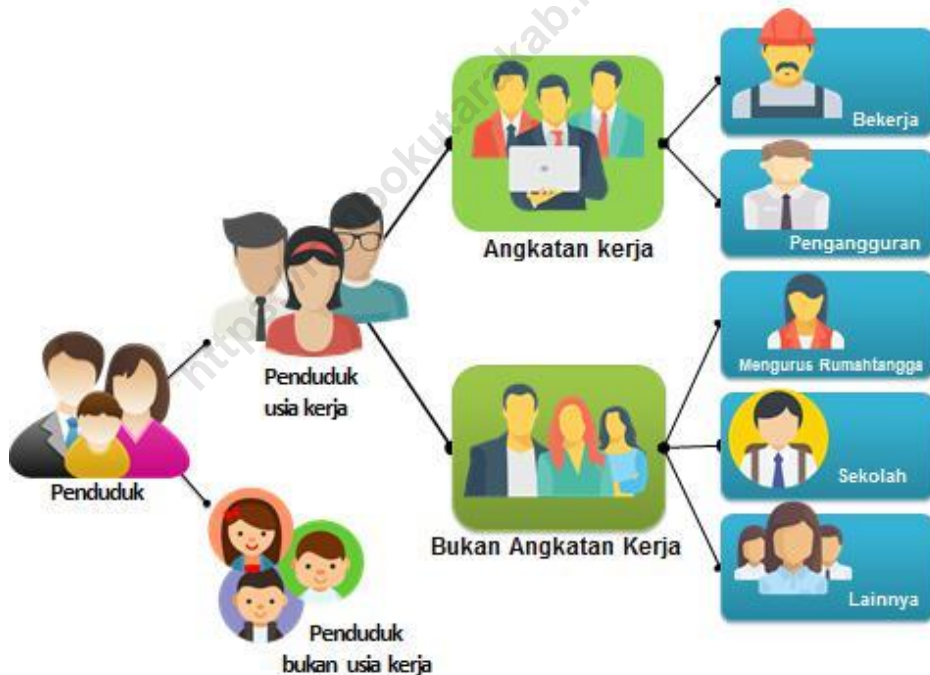
Gambar 1. Diagram Ketenagakerjaan

Konsep dan definisi yang digunakan dalam pengumpulan data ketenagakerjaan oleh Badan Pusat Statistik adalah The Labour Force Concept yang disarankan oleh International Labour Organization (ILO) . Konsep ini membagi penduduk menjadi dua kelompok, yaitu penduduk usia kerja dan penduduk bukan usia kerja. Selanjutnya, penduduk usia kerja dibedakan juga menjadi dua kelompok berdasarkan kegiatan utama yang sedang dilakukannya. Kelompok tersebut adalah Angkatan Kerja dan Bukan Angkatan Kerja .