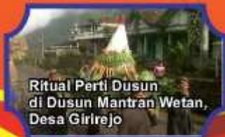
Ritual Perti Dusun di Dusun Mantran Wetan, Desa Girirejo