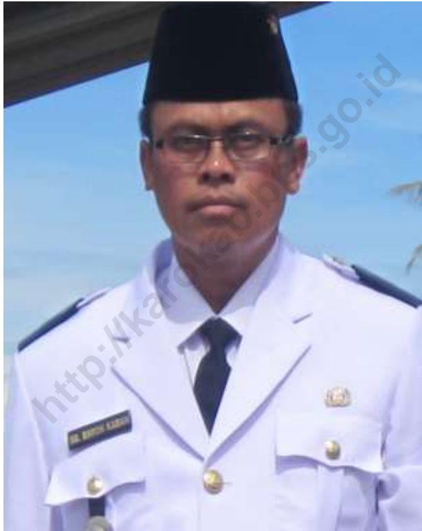
SB. BARON KABAN, SH