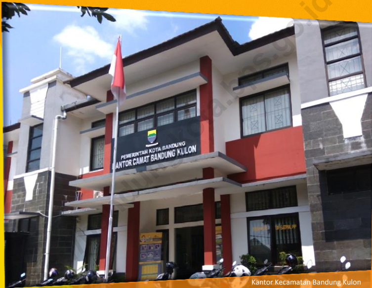
Kantor Kecamatan Bandung Kulon