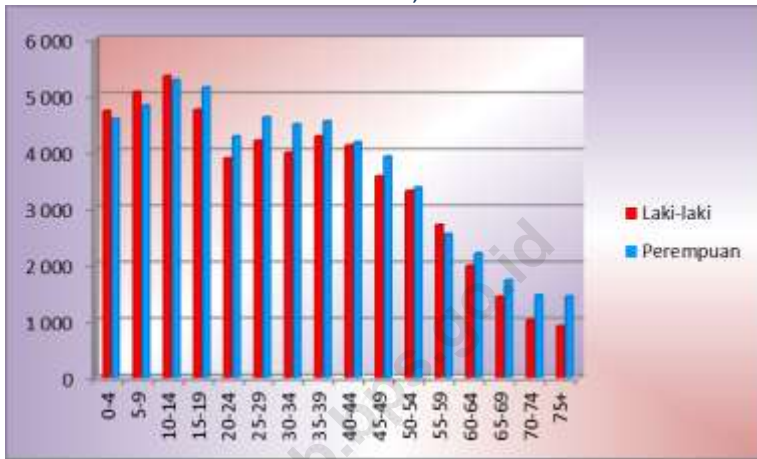
Grafik 1. Banyaknya Penduduk menurut Kelompok Umur dan Jenis Kelamin , hasil SP 2010