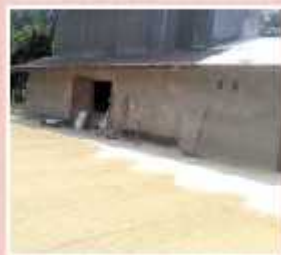
Industri Penggilingan Padi