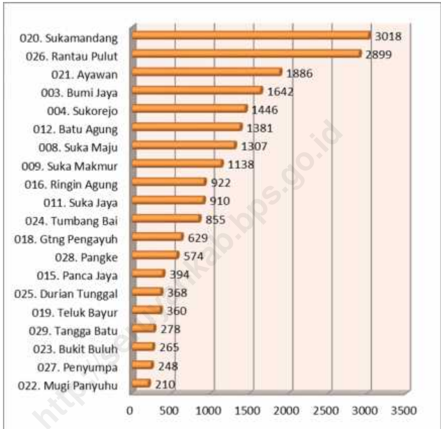
Figure 3.1 Population of Seruyan Tengah District by Village / Ward, 2012