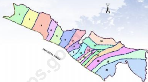
Peta Kecamatan Tanjung Kemuning

Kecamatan Tanjung Kemuning terletak di sebelah barat Pegunungan Bukit Barisan, termasuk dalam wilayah administrasi Kabupaten Kaur, Provinsi Bengkulu, Indonesia. Berjarak sekitar 40 km dari ibukota Kabupaten Kaur dan 200 km dari Provinsi Bengkulu. Luas wilayah daratan Kecamatan Tanjung Kemuning mencapai 72,91 km 2 .