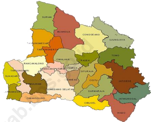
Gambar 1.1 Peta Kecamatan Darmaraja di Kabupaten Sumedang.

Kecamatan Darmaraja terdiri dari 16 desa dimana setiap desa dipimpin oleh kepala desa. Kepala desa dipilih secara langsung oleh masyarakat yang tinggal di wilayah tersebut. Hal tersebut mencerminkan bahwa demokrasi sudah dilaksanakan dari sejak dahulu.