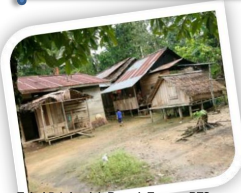
Tabel 5.1 Jumlah Rumah Tangga RTS Program Perlindungan Sosial Per Desa Tahun 2008

Tahun 2011 keluarga Pra Pejahtera di Kec. Darmaraja berada di desa Darmaraja sebanyak 268 Rumah Tangga