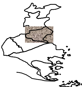
Tabel 1.1. Letak Kecamatan Gedung Tataan Menurut Batas Wilayah, 2014