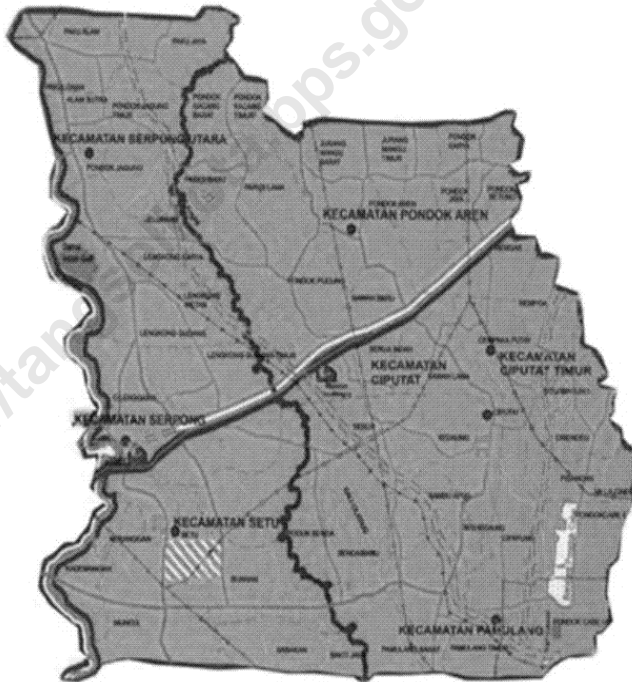
KOTA TANGERANG SELATAN