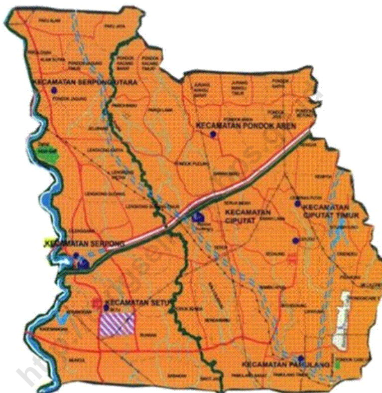
KOTA TANGERANG SELATAN