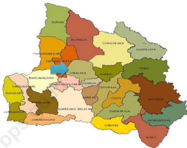
Statistik Geografidanklim Kec.Cimalaka