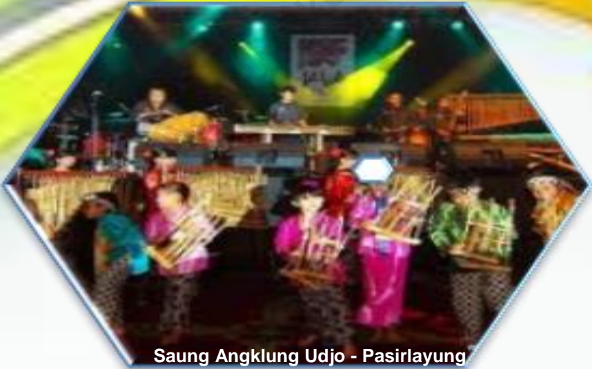
Saung Angklung Udjo - Pasirlayang