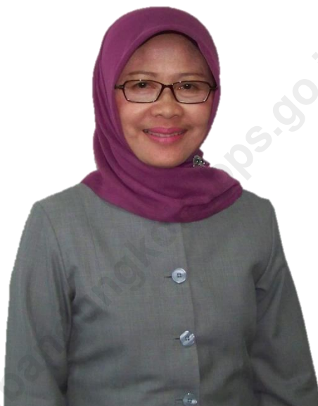
Ir. Hj. Sri Daty Kepala BPS Kota Bandung