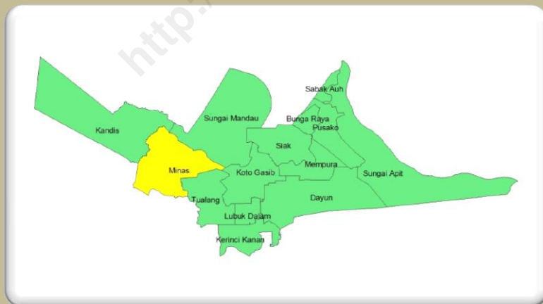
Peta Kecamatan Minas