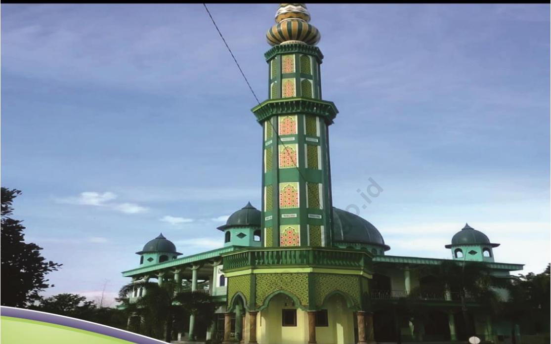
Ponpes Ketrampilan Al Ikhlas