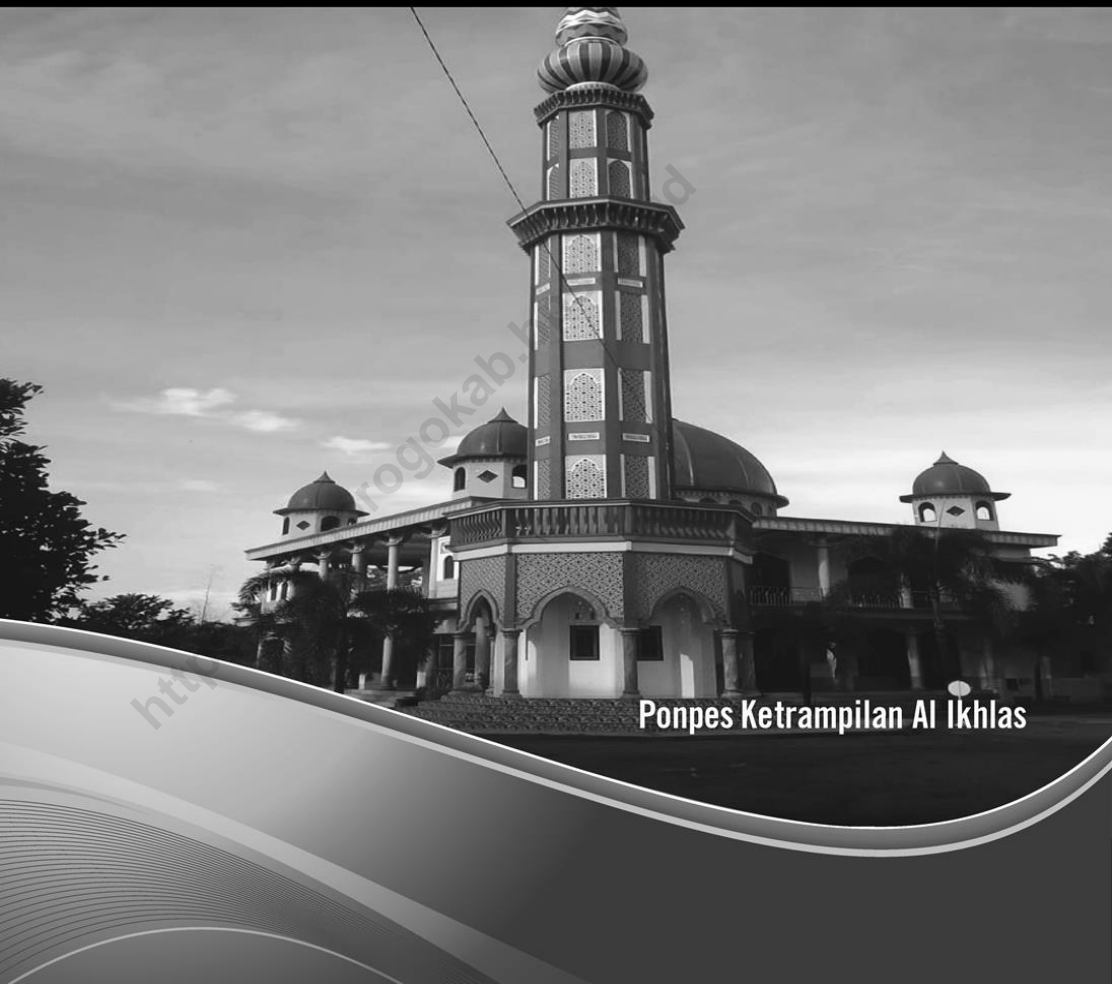
Ponpes Ketrampilan Al Ikhlas