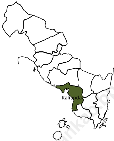
Tabel 1.1 Letak Kecamatan Kalianda Menurut Batasan Wilayah Tahun 2008