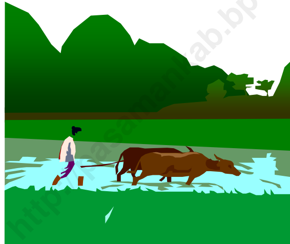
PERTANIAN PADI SAWAH