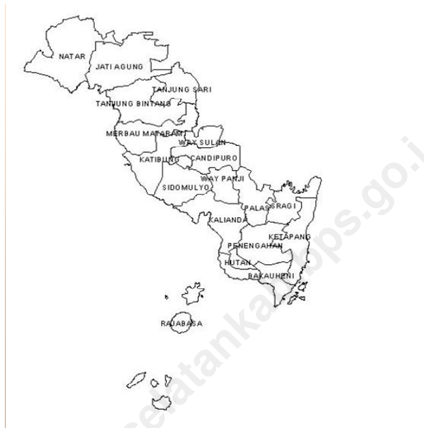
Letak Kecamatan Way Panji Menurut Batas Wilayah Tahun 2009