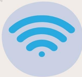
4 Operator yang signalnya kuat