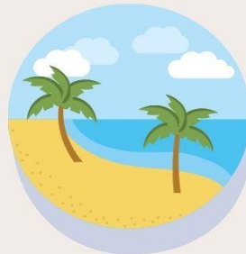
4 Objek Wisata