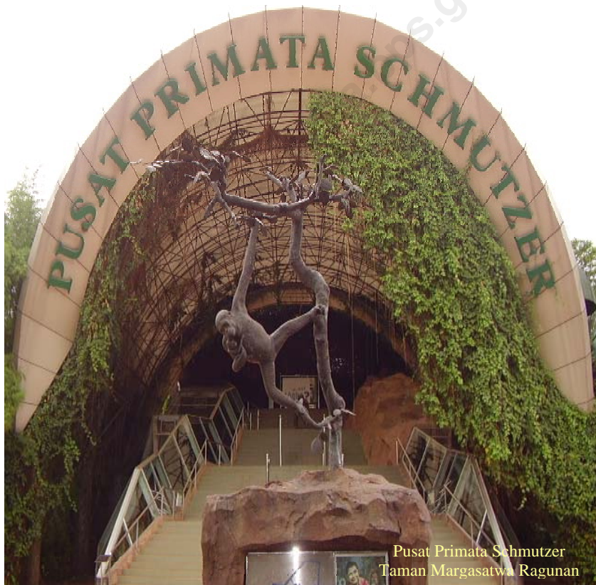
Pusat Primata Schmutzer Taman Margasatwa Ragunan