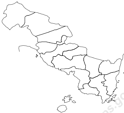
Tabel 1.1 Letak Kecamatan Way Panji Menurut Batas Wilayah Tahun 2008