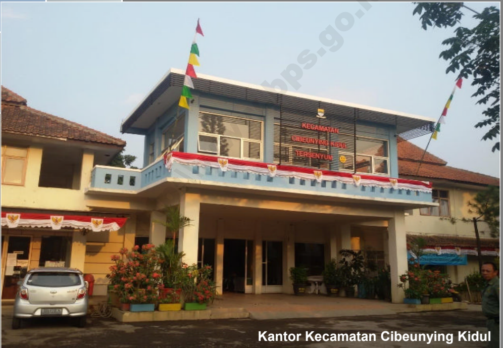
Kantor Kecamatan Cibeuuying Kidul