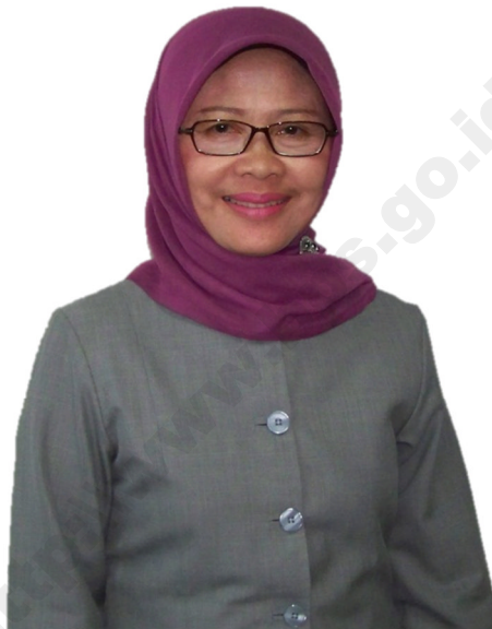
Ir. Hj. Sri Daty Kepala BPS Kota Bandung