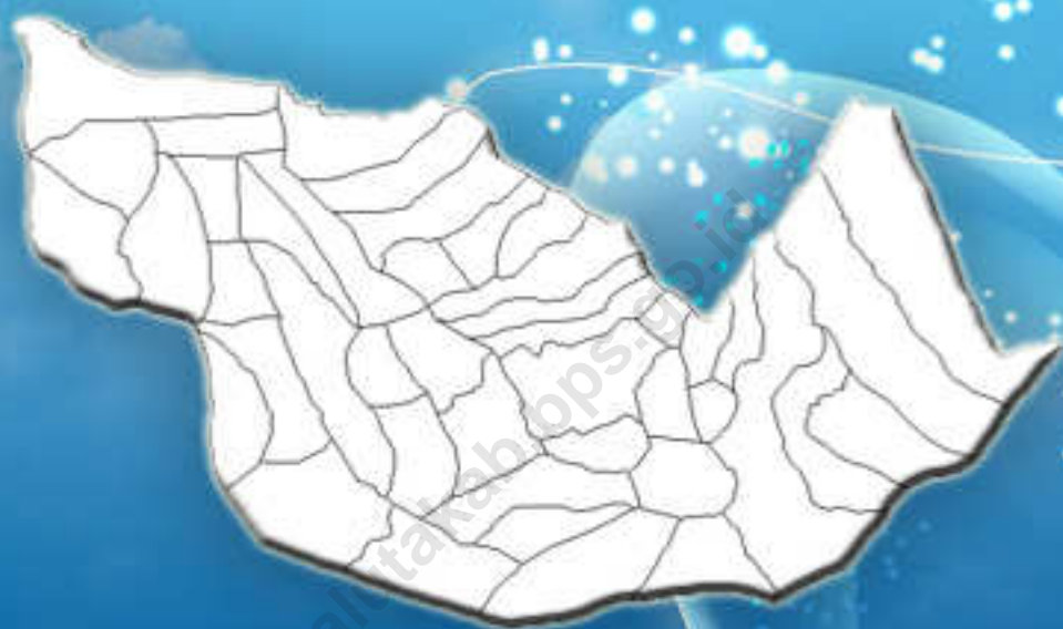
Peta Kecamatan Halongonan