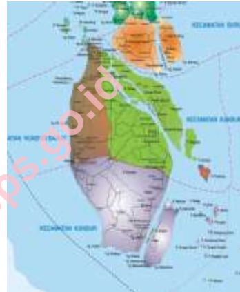
Luas Wilayah Menurut Desa/Kelurahan Tahun 2014

Luas wilayah Kecamatan Kundur Utara mencapai 123 km 2 dimana Desa Tanjung Berlian Barat merupakan daerah dengan luas wilayah terbesar, yaitu hampir seperempat total luas wilayah Kecamatan. Kecamatan Kundur Utara merupakan daerah yang berbukit-bukit dan wilayah nya terletak di pesisir pantai.