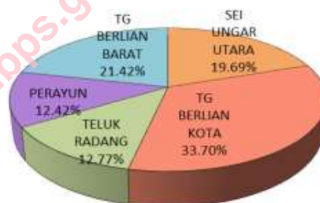
Banyaknya Kelahiran dan Kematian Menurut Desa/Kelurahan di Kecamatan Kundur Utara Tahun 2014