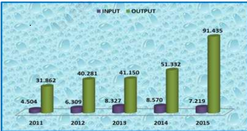
Gambar 3 Input dan Output PDAM, Tahun 2011 – 2015 (Juta Rupiah)

Perkembangan nilai output yang dihasilkan selama periode 2011 – 2015 menunjukkan adanya fluktuasi tetapi cenderung meningkat. Jika pada 2011 besarnya output yang dihasilkan sebesar Rp.31 862 juta rupiah maka pada tahun 2015 meningkat menjadi Rp.91 435 juta rupiah akibat adanya penambahan jumlah pelanggan dan peningkatan pendapatan/penerimaan lainnya (Tabel 13).