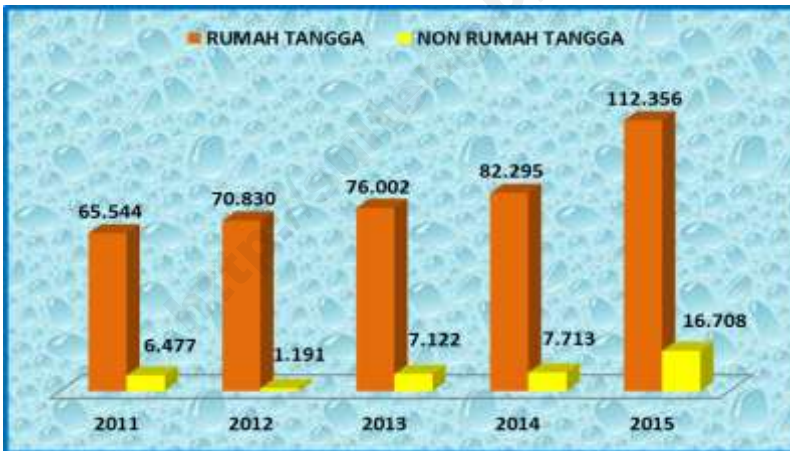
Gambar 2. Jumlah Pelangga PDAM Sulawesi Tengah Tahun 2011 -2015

husus dan sosial. Pada tahun 2015 kelompok rumah tangga masih merupakan pelanggan PDAM terbesar, yaitu mencapai 112 356 rumah tangga atau 87,05 persen dari total pelanggan, sedangkan pelanggan kelompok selain rumah tangga sebesar 16 708 pelanggan atau 12.95 persen yaitu terdiri dari badan social, rumah sakit, tempat ibadah, fasilitas umum, industri, instansi pemerintah, niaga, khusus dan lain-lain.