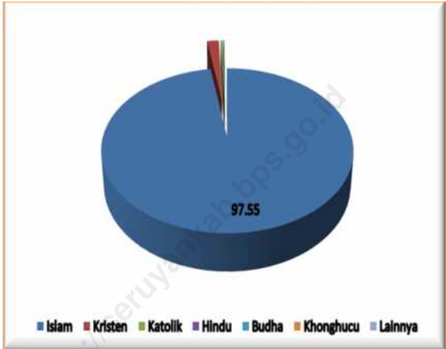
Persentase Penduduk Menurut Agama di Kecamatan Seruyan Hilir Percentage of Population by Religion in Seruyan Hilir Subdistrict, 2012