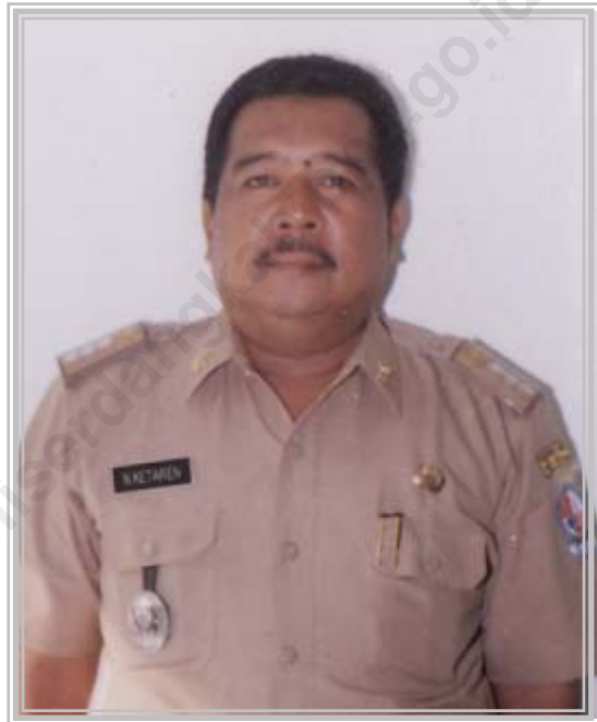
DRS. NEKEN KETAREN CAMAT SIBOLANGIT