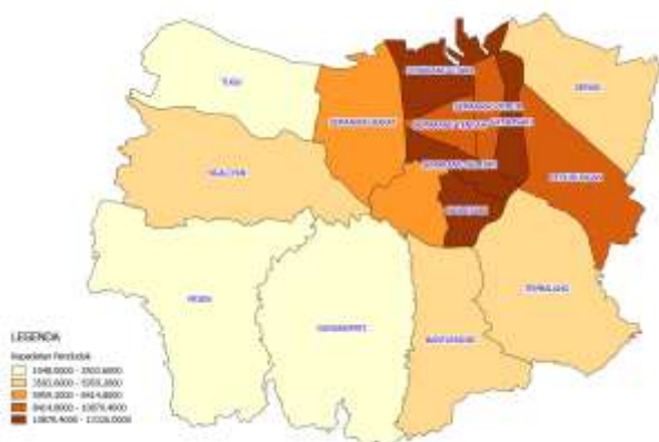
Peta Semarang Berdasarkan Tingkat Kepadatan Penduduk 2019

Kota Semarang berada pada posisi ditengah-tengah pantai utara Pulau Jawa, dibatasi sebelah barat dengan Kabupaten Kendal, sebelah timur dengan Kabupaten Demak, sebelah selatan dengan Kabupaten Semarang dan sebelah utara dibatasi oleh Laut Jawa dengan panjang garis pantai meliputi 13,6 kilometer.